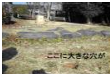
ここに大きな穴が